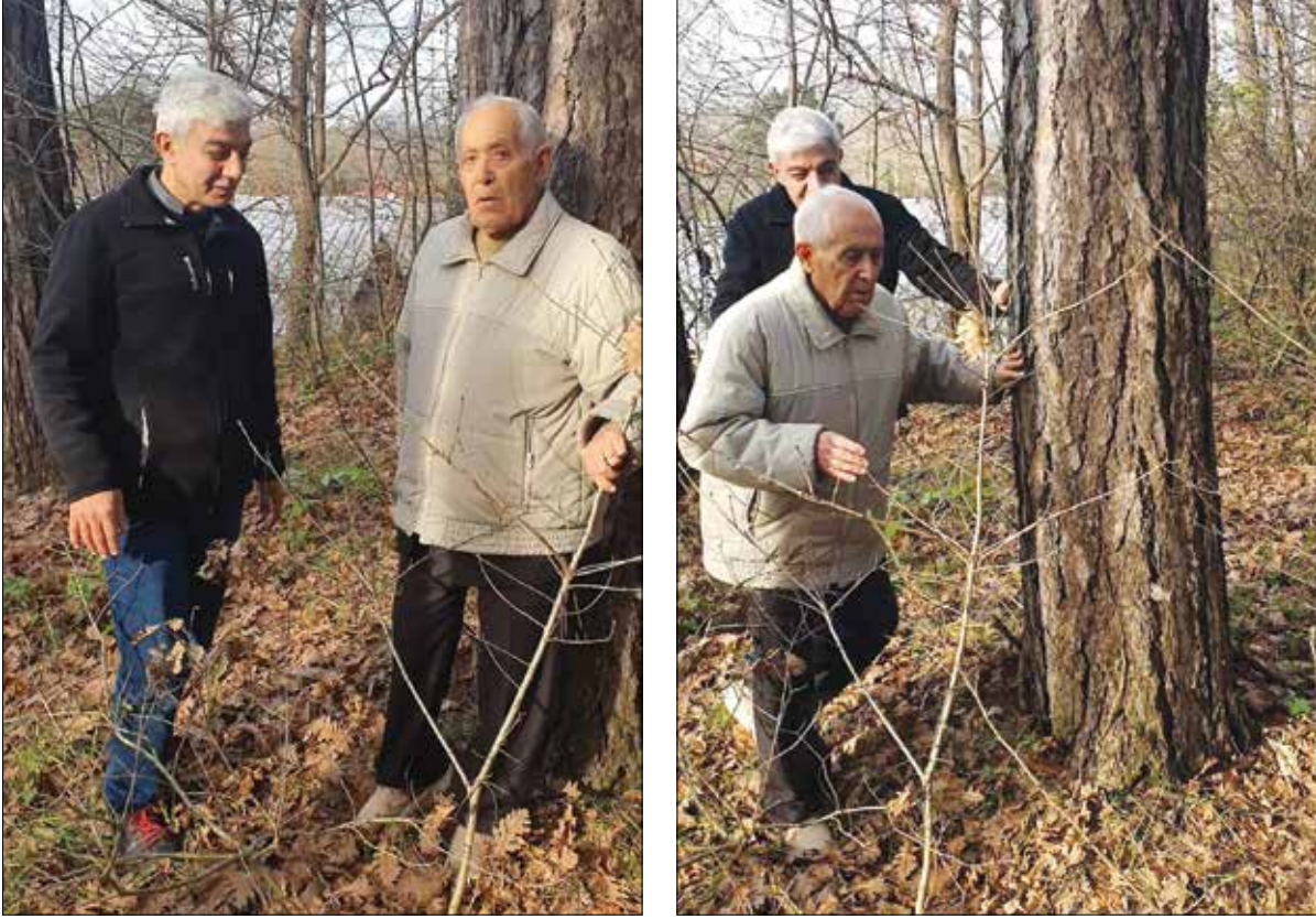
Resim 2. Baltalık ormanda 75 yıl sonra incelemeler.