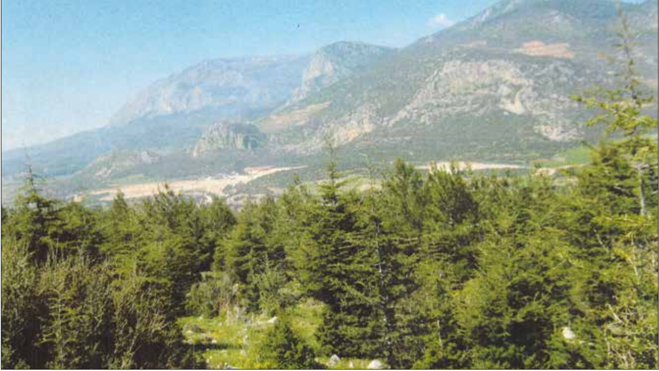
DOÇEV 1 Sedir sahası