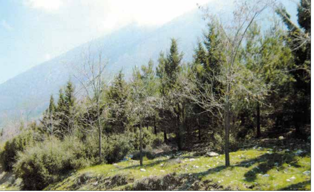
DOÇEV - 1 Kızılcım sahası