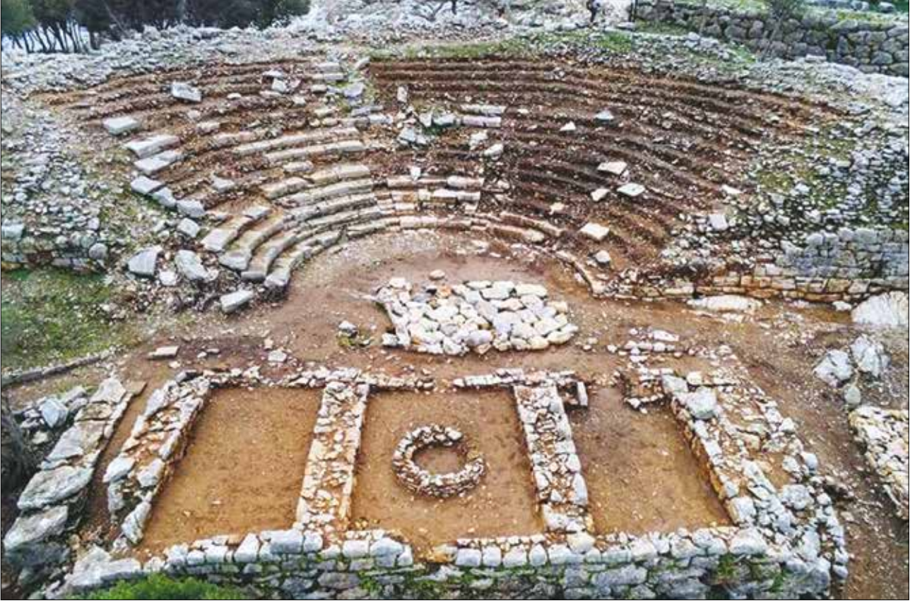
Şekil 1. Amos Antik Kenti tiyatrosu.

yumlu mezar tipinde yapılmış. Amos yakın çevresinde de askeri kuleler, çiftlik ve bir taş ocağı kalıntılara rastlanmıştır. İki koy (biri uzun sahiliyle Kumlubük, diğeri artık antik kentin adıyla anılan koy) arasında yer alan stratejik öneme sahip antik kent muhteşem manzaralara eşlik ediyor (Şekil 3). Bu bölgeye yapacağınız bir seyahatte harika manzaralar eşliğinde bu güzel antik kenti gezebilir, Kumlubük, Amos Koyu ve Turunç'un tertemiz denizinde bedeninizi ve ruhunuzu dinlendirebilirsiniz.