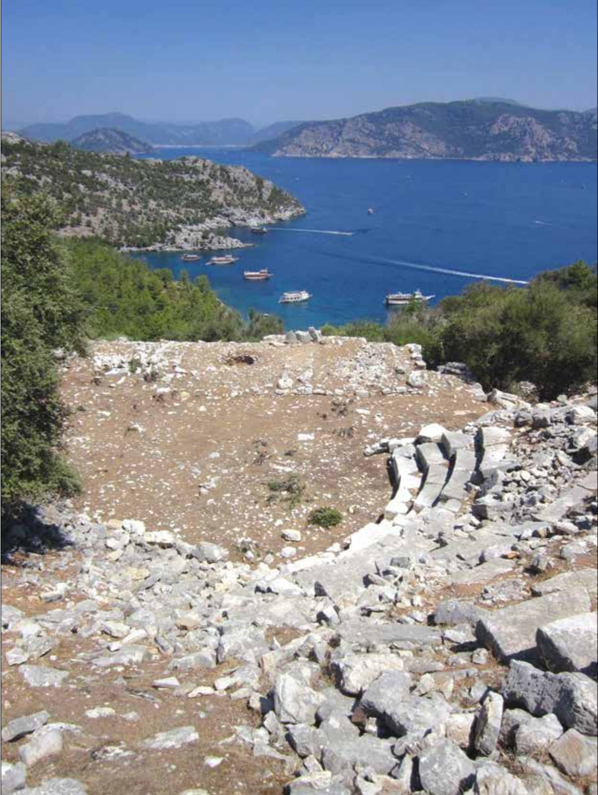
Şekil 2. Amos Antik Kenti tiyatrosundan Marmaris Körfezinin eşsiz manzarası.