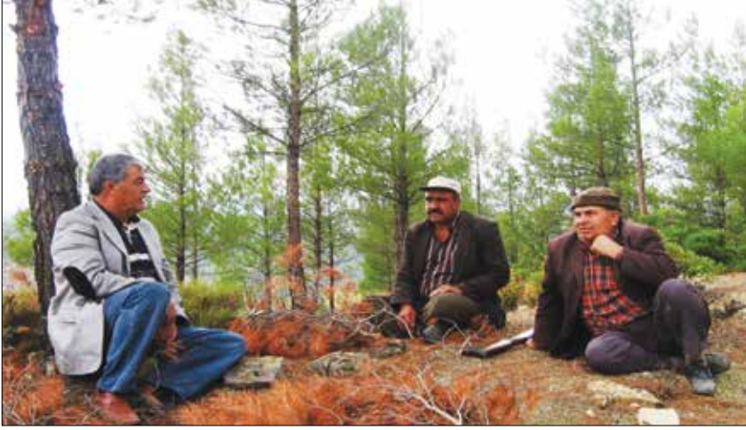
Eskere Orman İşletme Müdürlüğü, Sazak Köyü, Gerelli Mahallesi, 2000'li Yıllar