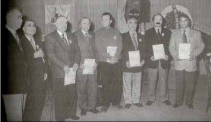
Denizlili Sanatçılar, bir ödül gecesinde / 09.04.1999