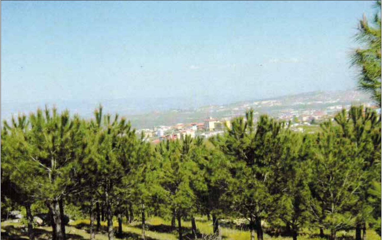
DOÇEV - 2 Fıstıkçamı sahası

Allah rahmet eylesin, mekânı cennet ve tüm ailesi ile meslektaşlarımızın başı sağ olsun.