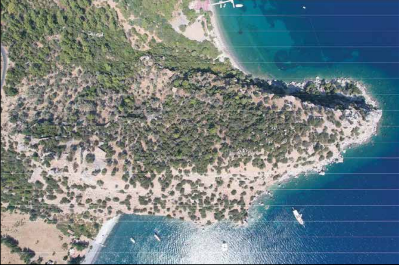
Şekil 3. Amos Antik Kentinin üzerinde bulunduğu Asarcık Tepesinin kuzeyinde Amos ve güneyinde Kumlubük Koyları yer almaktadır.

ve halkın bilinçlenmesini sağlamak amacıyla yoğun ormanlık alan içinde bulunan antik kentlerde zaman zaman etkinlikler düzenleniyor.