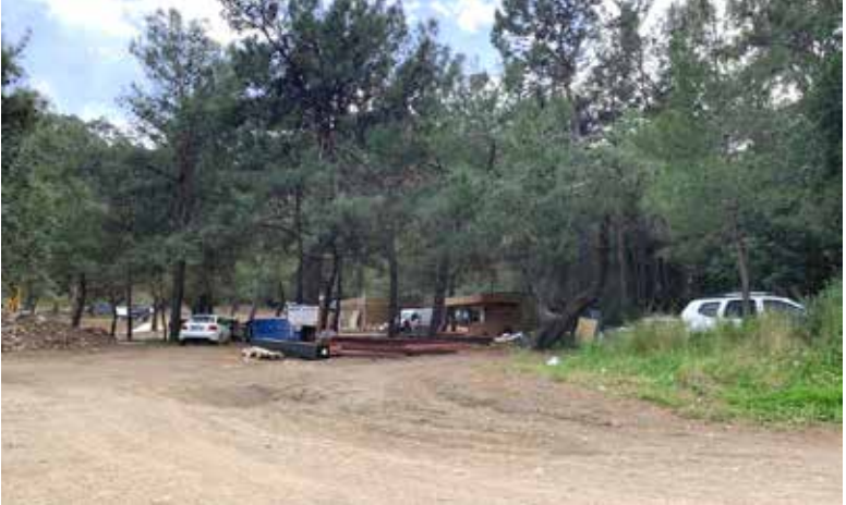
Alacasu Koyundaki inşaat alanından görünüm