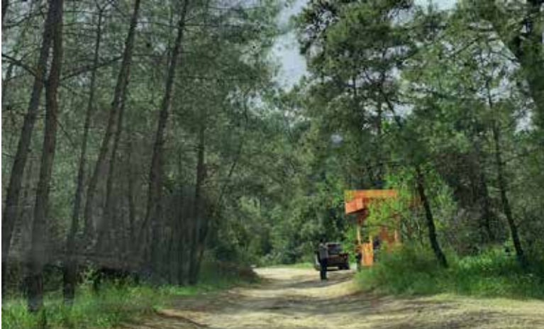
Alacasu Koyunda yapılan giriş ünitesi

Mahkemenin verdiği yürütmeyi durdurma kararını değerlendiren davanın avukatı Tuncay Koç, “Mahkemenin verdiği yürütmeyi durdurma kararı, Antalya Kültür Varlıklarını Koruma Bölge Kurulu'nun ilk kararına dayanıyor. 13. 10. 2022 tarihli Kurul kararının mevzuata aykırı olduğu görülmüştür. Bilirkişi keşfine kadar da ikinci bir yürütmeyi durdurma kararı verilmiştir. Ancak projenin temel dayanağı ortadan kalktığı için acilen diğer dosyalarda da yürütmeyi durdurma kararı verilmesi gerekmektedir. Şu anda Phaselis'te yapılan ihale ve proje yasadışı duruma düşmüştür. Çünkü bütün yasal süreç bu ilk işlemle (Kurul kararı) ile başlamıştır. Bunun da hukuk dışı olduğu mahkeme kararıyla sabit olmuştur. Alelacele yapılan işler, süreç içinde tekrar tekrar yenilene revize planlar, aslında bu projenin ne kadar sakat olduğunu göstermektedir. Phaselis'te şu anda herhangi bir açılış da yapılamaz, meşruluğu bulunmamaktadır” diye konuştu.