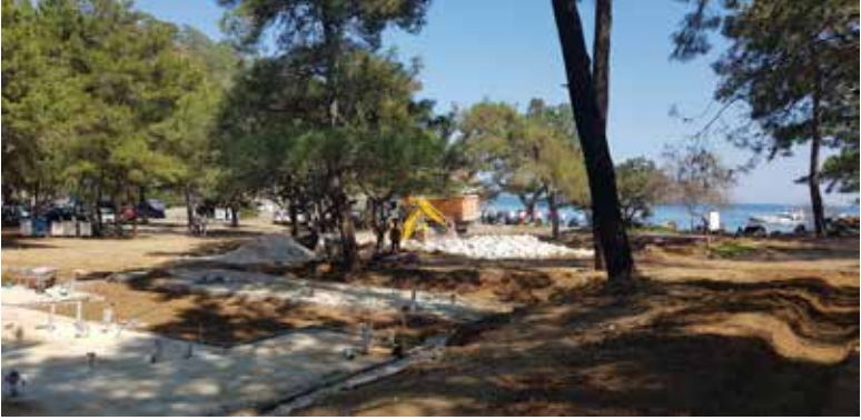
Şekil 5. Alacasu Koyunda Se-Fa Restorasyon San. İnş. Ticaret Ltd. Şti.'nin inşaat faaliyeti