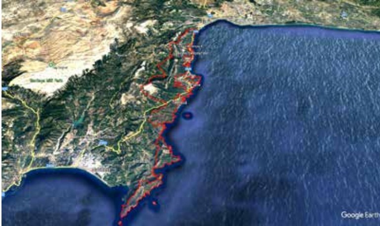
Ŗekil 1. Beydađları Sahil Millî Parkı sınırları

Tarım ve Orman Bakanlıđına bađlı Dođa Koruma ve Millî Parklar 6. Bölge Müdürlüğü Antalya Ŗube Müdürlüğünün, Antalya Kültür Varlıklarını Koruma Bölge Kuruluna ilettiđi Ŗerh notunda, Kültür ve Turizm Bakanlıđının Phaselis'te uygulamaya koyduđu projenin, Beydađları Sahil Millî Parkının 31.12.2020 onay tarihli Uzun Devreli GeliŖim Planının 5.3.5 plan hükümlerine uygun olmadıđı ve ilgili kurumdan görüŖ alınmadıđı belirtilerek, “5.3.5 Beydađları Sahil Millî Parkı alanında bu plan karar ve hükümleri dođrultusunda diđer kurum ve kuruluşlarca yürütülecek her türlü yatırım faaliyeti için Tarım ve Orman Bakanlıđı DKMP VI. Bölge Müdürlüğünün görüŖüne müteakip DKMP Genel Müdürlüğünden uygun görüŖ alınması zorunludur.” denildi.