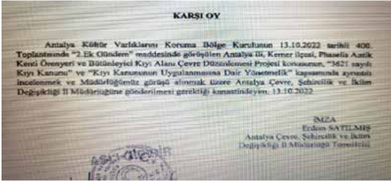
Şekil 3. Çevre, Şehircilik ve İklim Değişikliği İl Müdürlüğü karşı oy gerekçe yazıları

Projeyle ilgili Kurul kararında karşı oy kullanan Çevre, Şehircilik ve İklim Değişikliği Bakanlığı Temsilcisinin gerekçesinde ise Phaselis'te uygulamaya konulmak istenen projenin 3621 Sayılı Kıyı Kanunu ile Kıyı Kanununun Uygulanmasına Dair Yönetmelik kapsamında ayrıntılı incelenmesi gerektiği belirtiliyor. Kurum temsilcisinin karşı oy gerekçesinde ayrıca projenin ilgili mevzuat kapsamında ayrıntılı incelenmesi için Çevre, Şehircilik ve İklim Değişikliği İl Müdürlüğüne gönderilmesi gerektiğine değiniliyor.