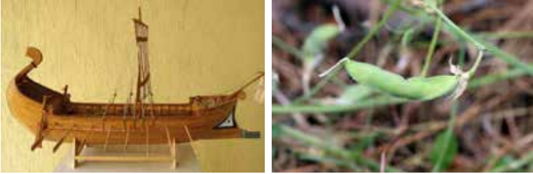
Şekil 1: “Phaselos” diye adlandırılan gemi örneği (solda), Phaselis burçağının tohumları (sağda)

Baklagiller ailesinden “ Lathyrus phaselitanus ” yani “Phaselis Burçağı”, Phaselis ve çevresinde yetişen endemik bir bitkidir ve Latince “ Phaselos ” (fasulye) den gelir. Phaselis Burçağı, Phaselis ile o kadar özdeşleşmiştir ki, Phaselis halkı, bitkinin fasulye şeklindeki tohumlarından esinlenerek gemilerine “ Phaselos ” adını vermişlerdir (Şekil 1).