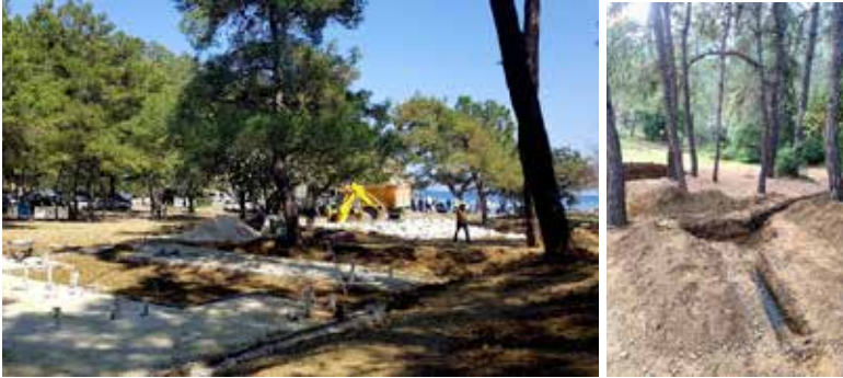
Şekil 6. Beydağları Sahil Milli Parkı ve 1. derece arkeolojik sit alanı içerisinde kalan Alacasu Koyunda 480 m 2 alanda sürdürülen inşaat çalışmaları

30 Ocak'ta yapılan ihalenin ardından yüklenici Sa-Fa Restorasyon Sanayi İnşaat firması ile 14 Şubat'ta yapılan yer tesliminden sonra Phaselis'in kuzeyinde yer alan Alacasu Koyu'nda iş makinelerinin korunan alana girmesiyle başlayan betonlaşma kamuoyunun tepkisini çekmişti. Kültür ve Turizm Bakanı Mehmet Nuri Ersoy, kamuoyundan gelen tepkilerin ardından beton yapıların söküleceğini, yerine kazık sistemiyle ahşap ünitelerin getirileceğini açıklamıştı.