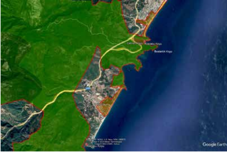
Şekil 3. Beydağları Sahil Milli Parkı'nın bölgeleri.

rol ünitesi, tuvalet ve soyunma ünitesi, otopark yer alabilir ve bu alanda yer alacak kullanımların yerleri ve büyüklükleri için hazırlanacak olan uygulama projelerinde ilgili Kültür Varlıklarını Koruma Bölge Müdürlüğü'nün uygun görüşü alınması zorunludur.