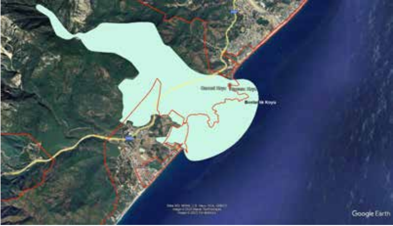
Şekil 2. Bölgedeki I. Derece Arkeolojik Sit Alanının yeri.

Phaselis Arkeolojik Sit Alanı ve Beydağları Sahil Milli Parkı içinde yer alan Alacasu (Cennet Koyu) ve Bostanlık Koyları'nda yapılan uygulamalara ilişkin projeler, Koruma Yüksek Kurulunun 05.11.1999 Tarih ve 658 Sayılı, 22.07.2008 Tarih ve 745 Sayılı İlke Kararları kapsamında değerlendirildiği bilinmektedir.