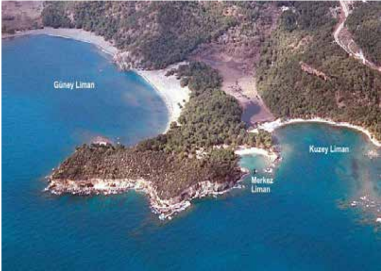
Şekil 2: Phaselis antik kenti koyları

Bakanlık her ne kadar Phaselis antik kenti ören yerine aşırı ziyaretçi olması sebebiyle, ziyaretçileri Alacasu ve