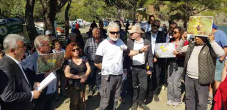
řekil 9. TOD Batı Akdeniz řube Bařkanı M. Necati Bař'ın konuřması.

2022 yılında Phaselis kazı ve arařtırmaları için 60.000 TL bütçe ayrılmıřtır. Yapılması düşünölen bu çalıřmanın ödeneđi ise yaklaşık 48 milyon TL olarak ilan edilmiřtir. Bakanlık 2023 yılında 750 adet arkeolojik kazı için yaklaşık 200 milyon TL ödenek ayrılmıřtır. Proje için ayrılan bedelin (48 milyon TL) Kültür ve Turizm Bakanı Mehmet Nuri Ersoy'un bahsettiđi gibi Bostanlı Koyu'na 9 metrekarelik büfe, 75 metrekarelik alana ise 13 tuvalet kabini, 5'er adet de giyinme ve duř kabini ve yine alan ierisinde bulunan Alacasu Koyu'na ise 20 metrekarelik büfe, 75 metrekarelik alana ise 13 tuvalet kabini, 5'er adet de giyinme ve duř kabini yapımı için çok fazla olduđu açıktır. Açıklamamalar ve proje sahasında yapılanlar/yapılacaklar çeliřkili bulunmaktadır." dedi (řekil 9).