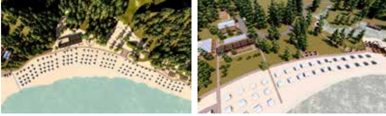
Şekil 5. Projede Alacasu ve Bostanlı Koyları için planlanan plaj düzenlemeleri