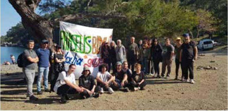
Şekil 6. Farklı çevreci sivil toplum örgütlerinden incelemeye katılan gençler.

delesini anlattı. Kültür ve Turizm Bakanı Mehmet Nuri Ersoy'un projeye ilişkin toplumsal tepkilere karşılık, iki koyda toplam 179 m 2 'lik bir inşaat yapılacağını söylerken maalesef kamuoyunu yanıltmayı amaçladığını, sadece Alacasu Koyu'nda temel atılmış alanın herkesin gözü önünde yapılan ölçümüne göre zemin alanlarının 400 m 2 'nin üstünde olduğunu ifade etti (Şekil 7).