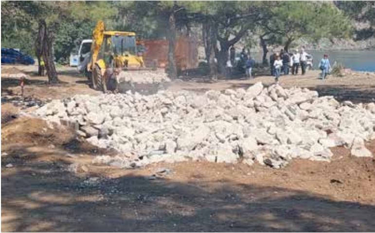
Şekil 3: Phaselis antik kentinde dokunun bozulması

Öncelikle Phaselis Alacasu ve Bostanlı liman koylarında henüz kazı yapılmamıştır. Ancak yüzeyde yapılan araştırmalar buranın büyük bir arkeolojik potansiyeli olduğunu göstermektedir. Sadece karada değil su altı arkeolojisi bakımından da Phaselis'in bu üç liman koyu önemli arkeolojik veriye sahiptir. Tarihin en büyük iki antik çağ batığı olan Uluburun ve Gelidonya Batıklarının bu deniz sahasında bulunması, Phaselis'in antik çağ ticaret rotaları üzerinde yer alması ve Adrasan'da yeni tespit edilen bir antik çağ batığının kazılarının devam ediyor olması sualtı kültür mirasının bilimsel ve korumacılık açısından hassasiyetle göz önünde tutulması gerekmektedir. Phaselis'te 70'li yıllarda başlayan ilk arkeolojik