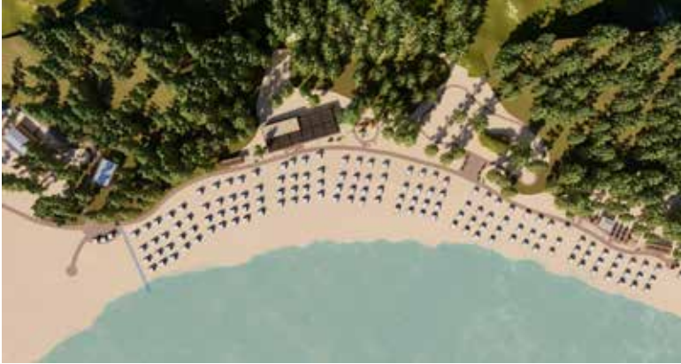
Şekil 4. Phaselis'te yürütülen projenin bir çizimi

Kıldan ve Yörük tarafından Alacasu-Cennet Koyu (585 Ada 1 Parsel) için planlanmış projeler incelendiğinde; yaklaşık 3000 m 2 proje alanı olduğu ve inşaat emsalinin %20'yi bulduğu görülmüş ve bu nitelikteki alanlar için yapılan rekreasyon projelerinin emsali %51'i geçmemesi gerektiği ifade edilmiştir. Ayrıca projede sahil uzunluğu yaklaşık 150 m olan koyda, 140 adet şezlong kullanımı planlanmış ve projede bulunan yapıların kotunun da 2 katı geçtiği tespit edilmiştir (Şekil 4).